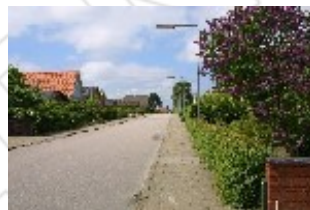
Østermarksvej set med retning mod fjorden.