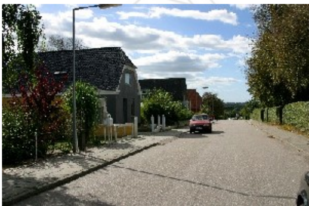
Området har et markant grønt islæt og fra Højens Allé er der udsigt til fjorden. Det er også hensigten at bygge videre på disse kvaliteter.