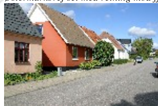
Hvorupvej er et strukturerende element i området