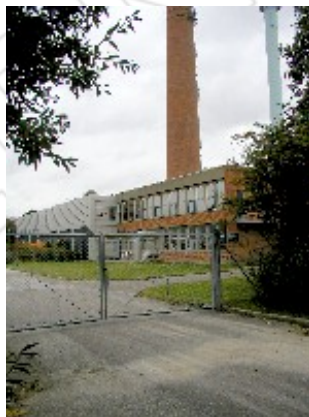
Varmecentralen på Vikingevej.

Området skal fortsat anvendes til tekniske anlæg, herunder varmecentral m.m. I den fremtidige udvikling af området lægges der vægt på, at området fremstår grønt mod omgivende boligområder og Vikingevej.