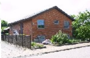
Eksempel på et karakteristisk parcelhus i området.

Det er hensigten at sikre Hvorupvej, Østermarksvej og Højens Allé som identitetsskabende historiske strukturer. Den typiske placering af bebyggelsen tæt på gadelinjen er et bevaringsværdigt karaktertræk.