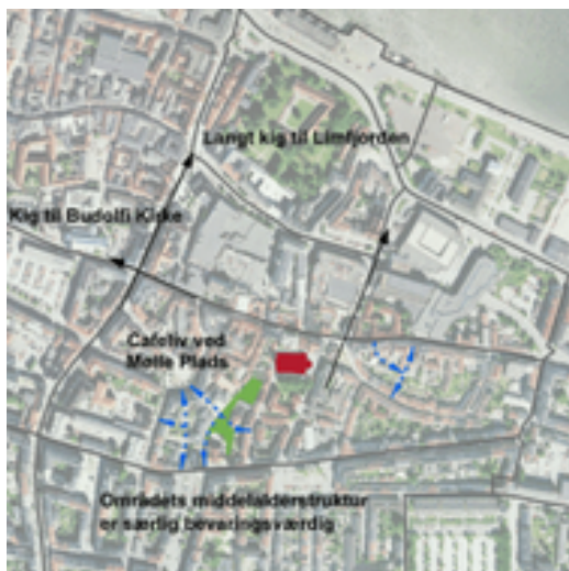
Th.ø. De lave huse i kontrast til Vor Frue Kirkes bygningsvolumen. Th.n. Byliv ved Mølle Plads.