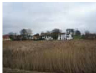
Nibe Strandpark ligger ud til strandensarealet ved Aalborgvej

Området er et lavtliggende boligområde, der udgør en del af bykanten mod fjorden og som i kraft heraf har en attraktiv beliggenhed. Det er målet at udvikle området til et attraktivt område med åben/lav, tæt/lav eller etageboliger i op til 2 etager.