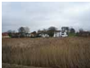
Nibe Strandpark ligger ud til strandensarealet ved Aalborgvej

Området er et lavtliggende boligområde, der udgør en del af bykanten mod fjorden og som i kraft heraf har en attraktiv beliggenhed. Det er målet at udvikle området til et attraktivt område med åben/lav, tæt/lav eller etageboliger i op til 2 etager.