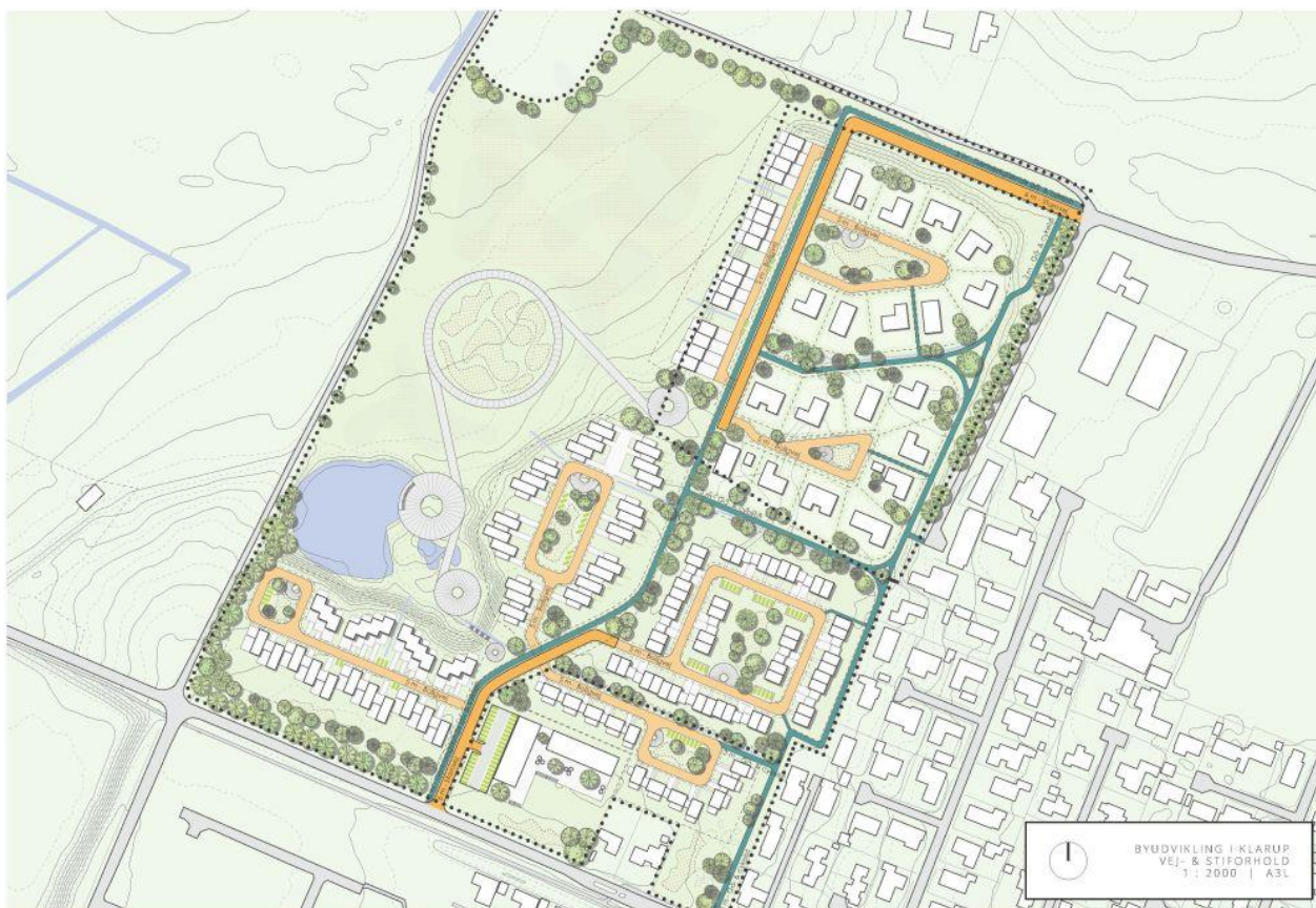
Figur 1: Illustration fra lokalplan.

Området ejes af Skagen Beton, og der er lagt op til, at der skal være 5 boligområder. Overordnet er der stor terrænforskel for den østlige og vestlige del af området. Den vestlige del er i dag engområde, og er ikke egnet til bebyggelse. Dette område er planlagt udlagt til rekreativt område for nye beboere, men vil også være muligt at anvende for andre beboere i området.