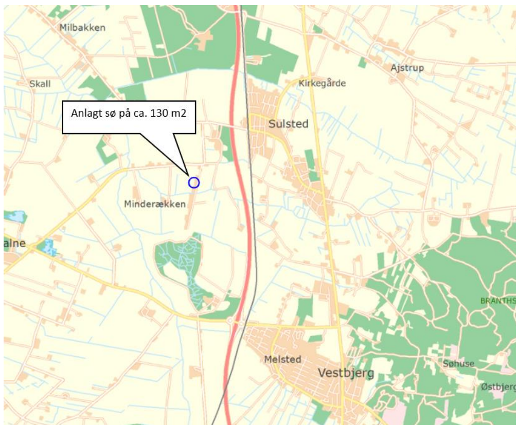
Figur 1: Søen er anlagt indenfor den blå cirkel

./. Aalborg Kommune giver herved en lovliggørende tilladelse efter planlovens § 35 til ændret arealanvendelse ved anlæg af en op til 130 m 2 stor sø på matr.nr. 11s Sulsted By, Sulsted. Arealet ligger ca. 1 km sydvest for Sulsted by.