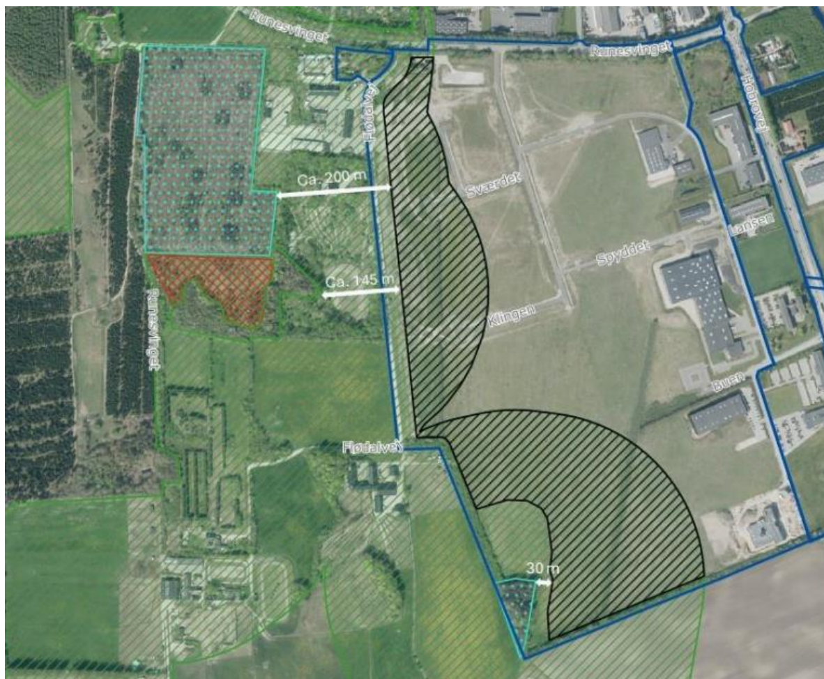
Kort bilagt kommunens ansøgning