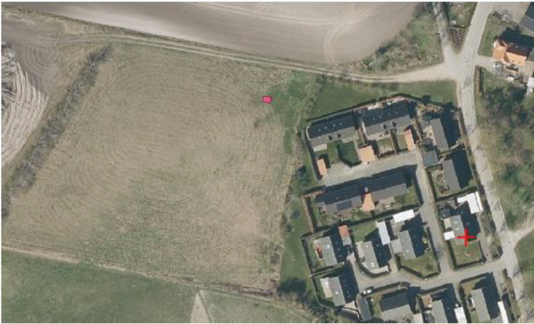
Placering på Vejrholm 35