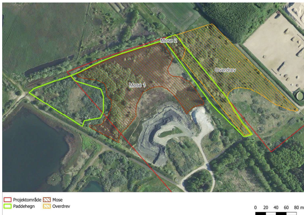
Figur 3. Fra ansøgningen. Udformning af paddehegn.

Flytning af padder ønskes foretaget i løbet af sommeren 2025 for overdrev, mose 2 og det indhegnet område (sandbunke) til venstre på Figur 3.