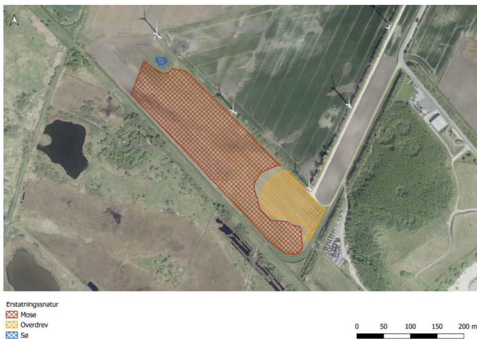
Figur 2. Fra ansøgningen. Placering af erstatningslevested (beskyttet sø), erstatningsnatur samt eksisterende mose.

Ansøger har vurderet, at dispensationen ikke hindrer opretholdelse af bevaringsstatus for spidssnudet frøbeskrevet i ansøgningen, at: