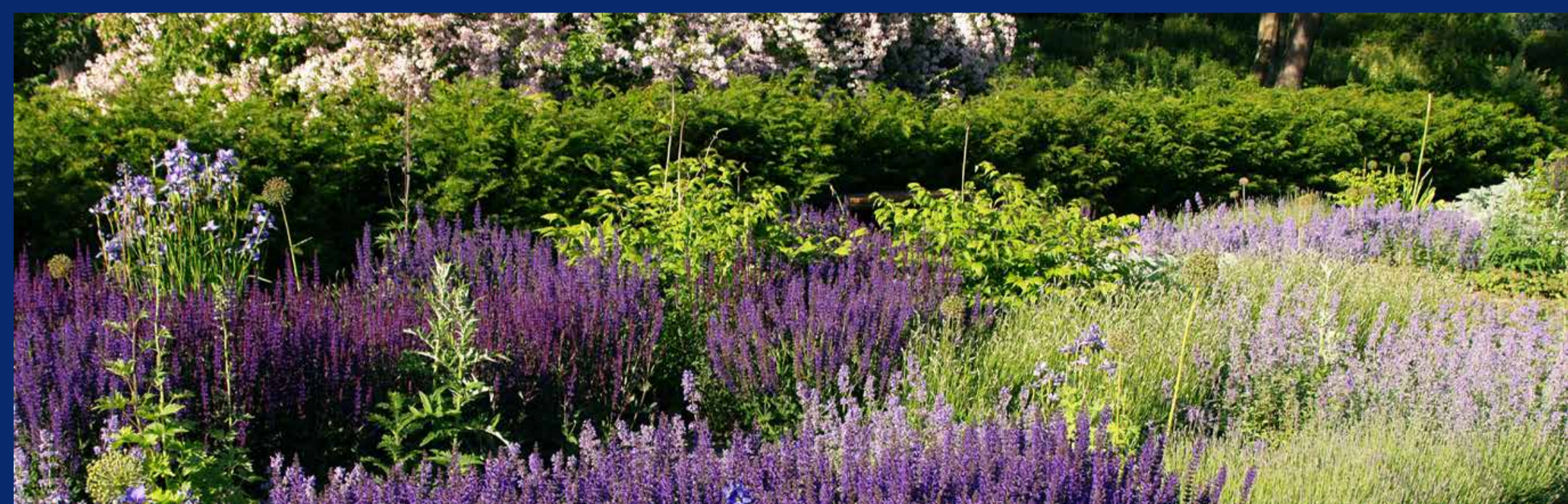
Staudebedet i al sin frodighed