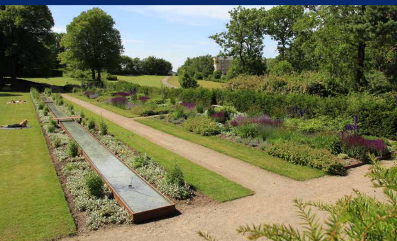
Spejlbassin og staudebed

Parken byder bl.a. på en af Danmarks største samlinger af paradisæbletræer, legeplads, boldbane og kællebakke om vinteren.