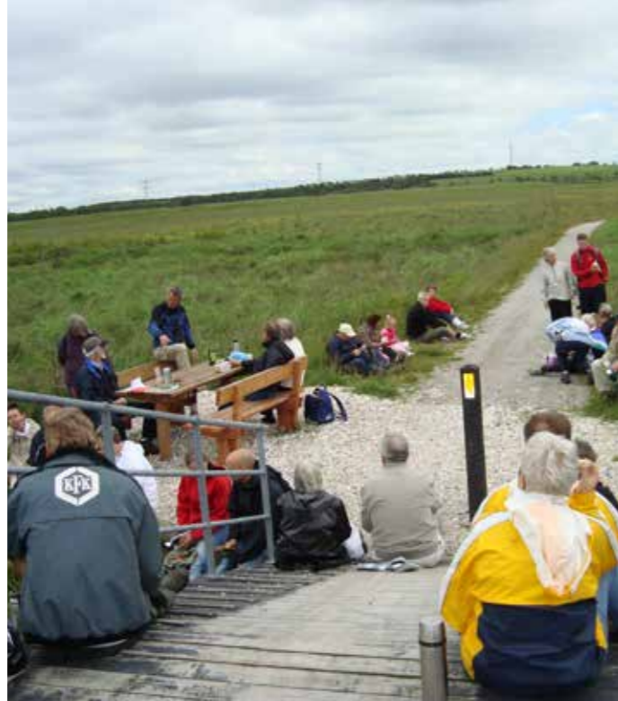
Omkring Svenstrupholm er der blevet etableret nye trampestier, bygget to broovergange og opsat borde/bænke