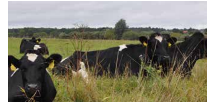
Som led i naturplejen af Østerådalens Syd afgræsses ådalens enge i sommerhalvåret af kreaturer

Naturgenopretningsprojekterne i Østerådalens Nord og Syd blev støttet af Naturstyrelsen, det daværende Nordjyllands Amt og Aalborg Kommune i samarbejde med Friluftsrådet og Danmarks Naturfredningsforening.