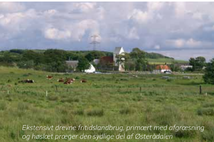
Ekstensivt drevne fritidslandbrug, primært med afgræsning og høslæt præger den sydlige del af Østerådalene

Ådalen gennemskæres af Østerå, et 15 km langt vandløb, der udspringer nordøst for Støvring og munder ud i Limfjorden. Åen har bl. a. tilløb fra Guldbæk nord for Svenstrup.