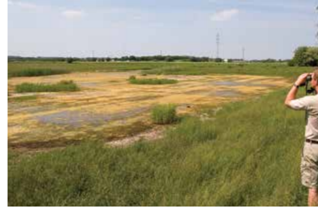
I den centrale del af området er der anlagt to mindre søer, Fuglesøerne, der får tilført vand, når den naturligt går over sine bredder