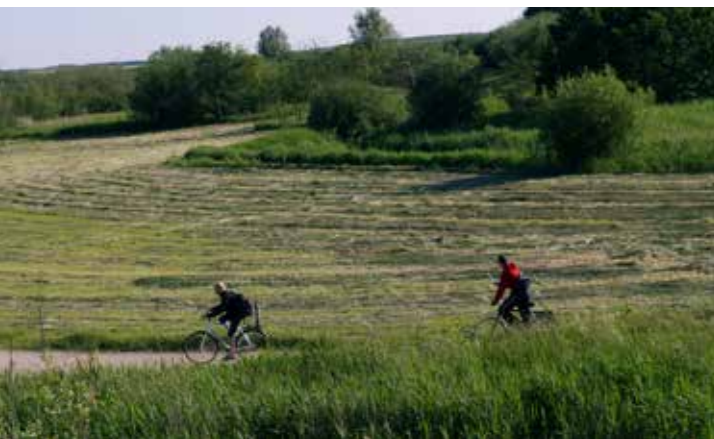
I Østerådalens Syd er der mange muligheder for at dyrke et aktivt friluftsliv

Du kan læse mere på www.aalborg.dk/aktivtfriluftsliv . Her kan du også hente folderne om henholdsvis Østerådalens Syd og Nord samt Guldbækstien som pdf.