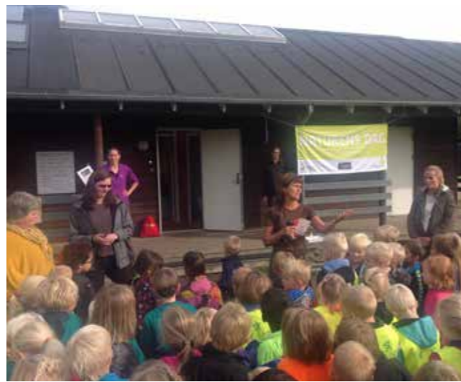
Infohuset benyttes af mange forskellige interessegrupper, især kommunens skolebørn, børnehaver og dagplejere