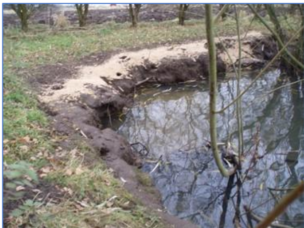
Billede: Fodring af vildt og rotter

Når kommunen informerer og vejleder borgere om rotter, sker det typisk ved den direkte kontakt mellem bekæmper og borger, men først når skaden er sket. Til generel information benytter kommunen sig af kommunens egen hjemmeside, men her vil det typisk oftest være borgere, der allerede har problemet tæt på, der opsøger denne information. Hjemmesiden skal opdateres, så borgerne har let adgang til information og viden om, hvorledes en rottesag forløber og almene forebyggelsesråd.