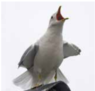
Stormmågen kan være en højkrøstet nabo

Men: De store måger kan i yngletiden være yderst larmende og aggressive naboer. Den lille, ellers så charmerende, tyrkerdue kan drive én til vanvid med sin insisterende kurren lige uden for ens soveværelsesvindue i de tidlige morgentimer. Storbyens store flokke af vilde tamduer kan akkumulere et helt fantastisk svineri, der hvor de yngler.