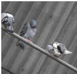
Tamduer på rad og række

Der er af og til borgere, der henvender sig til By- og Landskabsforvaltningen, fordi de føler sig stærkt generet af duer eller måger på deres ejendom. Problemerne er størst i Aalborg Midtby samt i Nørresundby.