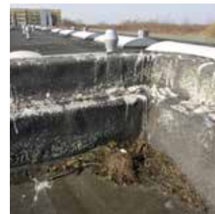
Stormmågerede på tag

For duernes vedkommende er metoden med at fjerne reder mindre anvendelig, da rederne ofte anlægges på utilgængelige steder.