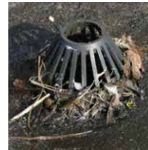
Redemateriale og føderester medfører tilstoppede afløb og udluftningskanaler