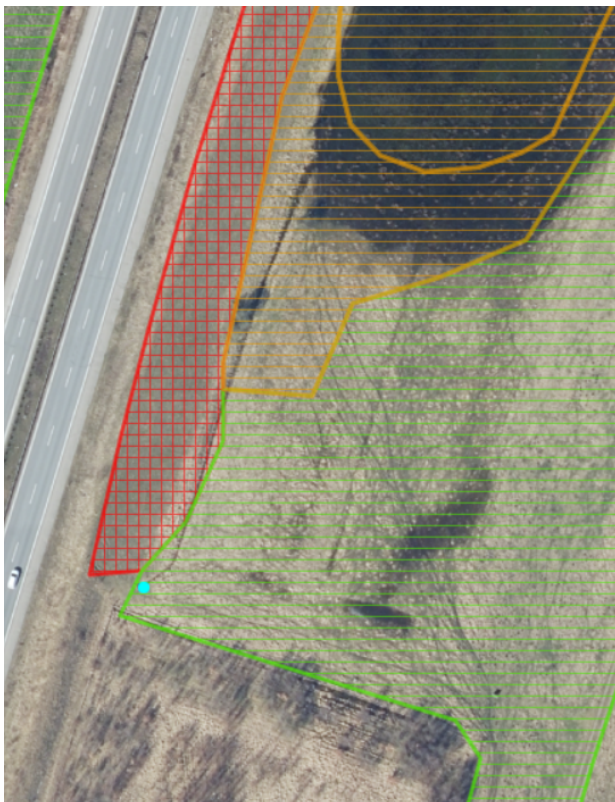
Fig. 2 Udledningspunkt (lyseblå) i forhold til eng (grøn skravering) og mose (orange skravering)

Udledningen af renpumpningsvandet må ikke i perioden marts til september medføre tilførsel af koldt vand til den beskyttede mose, der ligger i et eng-mosekomplekset. Det skal sikres, at udledning sker på et sted og med en hastighed, der ikke medfører afledning mod nord ind i området med eng-mosekomplekset.