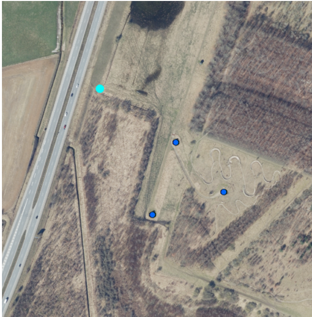
Fig. 1 Placering af borer (mørkeblå) og udledningspunkt (lyseblå)

Det maksimale skyllebehov i forbindelse med en skyllesituation forventes at blive renpumpning af én boring ad gangen med en pumpeperiode på 2 uger. Maksimumydelsen for boring 6 (DGU nr. 34.1677) og boring 9 (DGU nr. 34.1929) er 25 m 3 /t, mens boring 5 (DGU nr. 34.1676) har en maksimumydelse på 15 m 3 /t. Boring DGU 34.1677 forventes nedlagt i 2024 og erstattet med en tilsvarende boring. Der forventes behov for reovering af borerne, som konsekvens af driftsårsager, hvor der forventes renpumpning af ligeledes 2 ugers varighed.