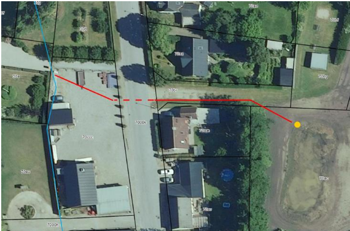
Figur 1: Placeringen af det nye rørlagte vandløb fra sandfangsbrønd (gul prik) til udløb i Øster Hassing Hede-bæk (blå linje) er markeret med en rød linje på oversigtskort med matrikelskel.