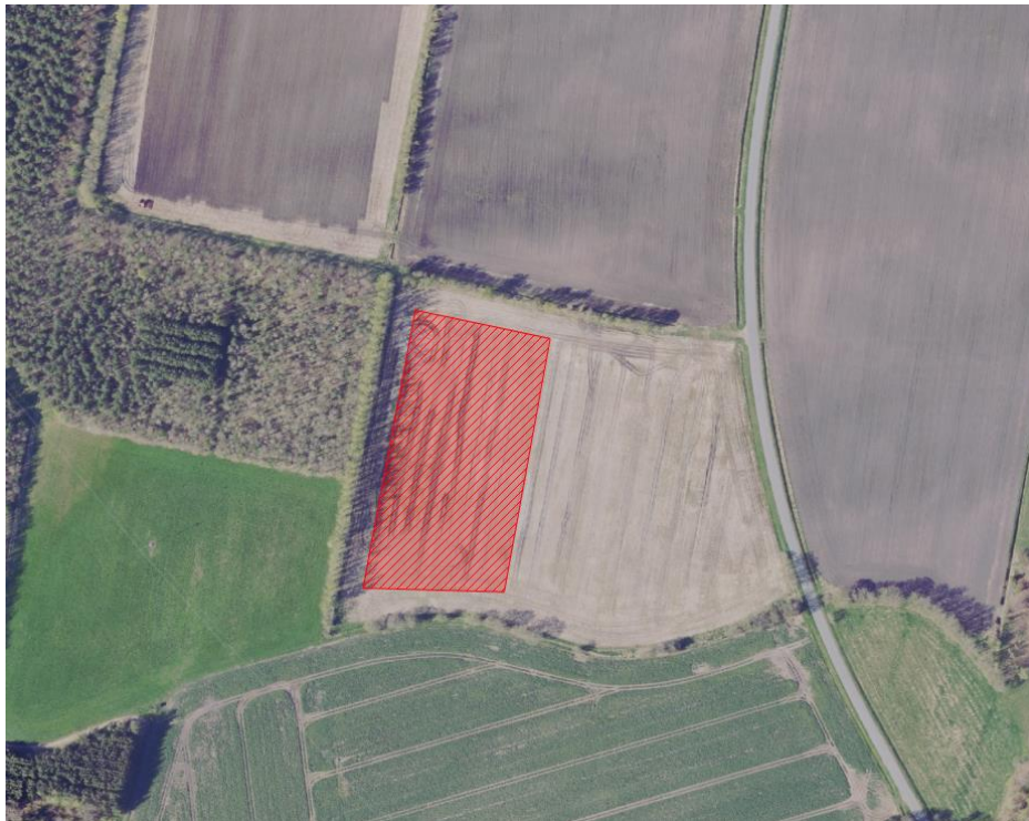
Figur 2: Søen anlægges inden for det skraverede areal

Søen anlægges ved opgravning af en fugtig lavning i et landbrugsareal.